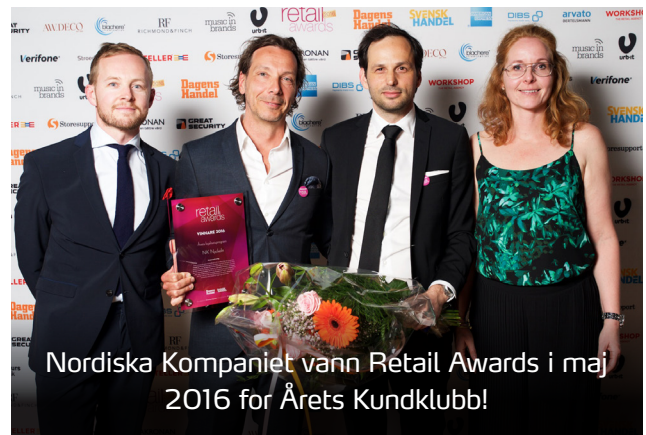
Nordiska Kompaniet vann Retail Awards i maj 2016 for Årets Kundklubb!